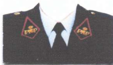
MODELO FOTO (OFICIAL DE SERVICIOS)